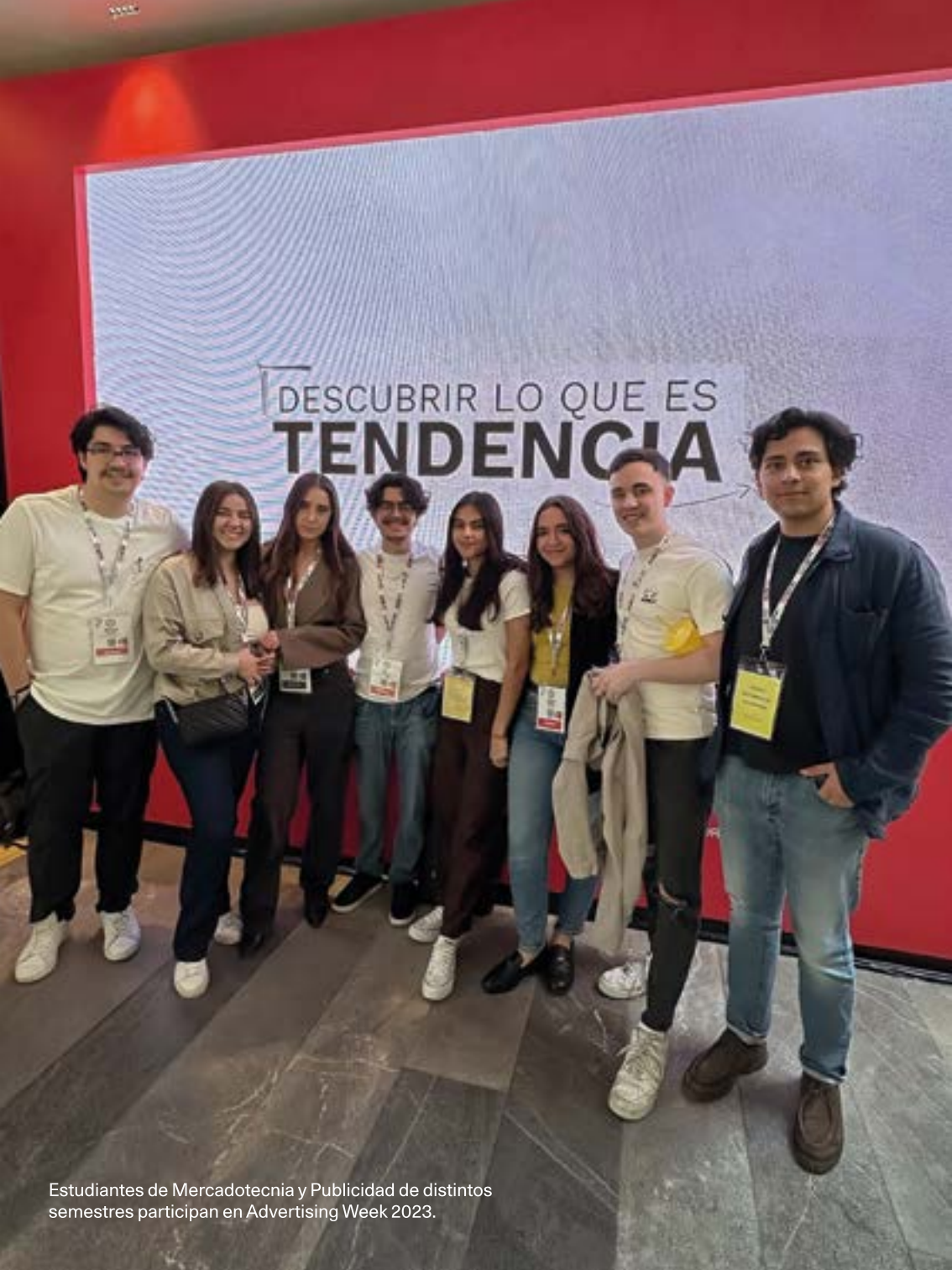
Estudiantes de Mercadotecnia y Publicidad de distintos semestres participan en Advertising Week 2023.