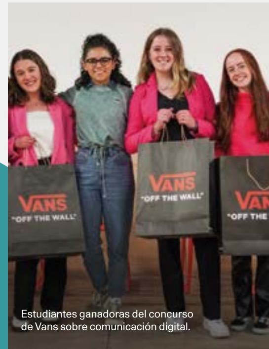
Estudiantes ganadoras del concurso de Vans sobre comunicación digital.