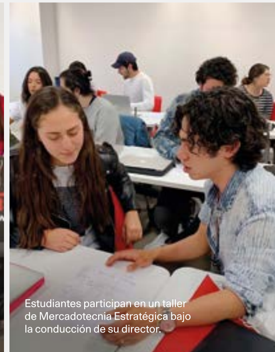
Estudiantes participan en un taller de Mercadotecnia Estratégica bajo la conducción de su director.