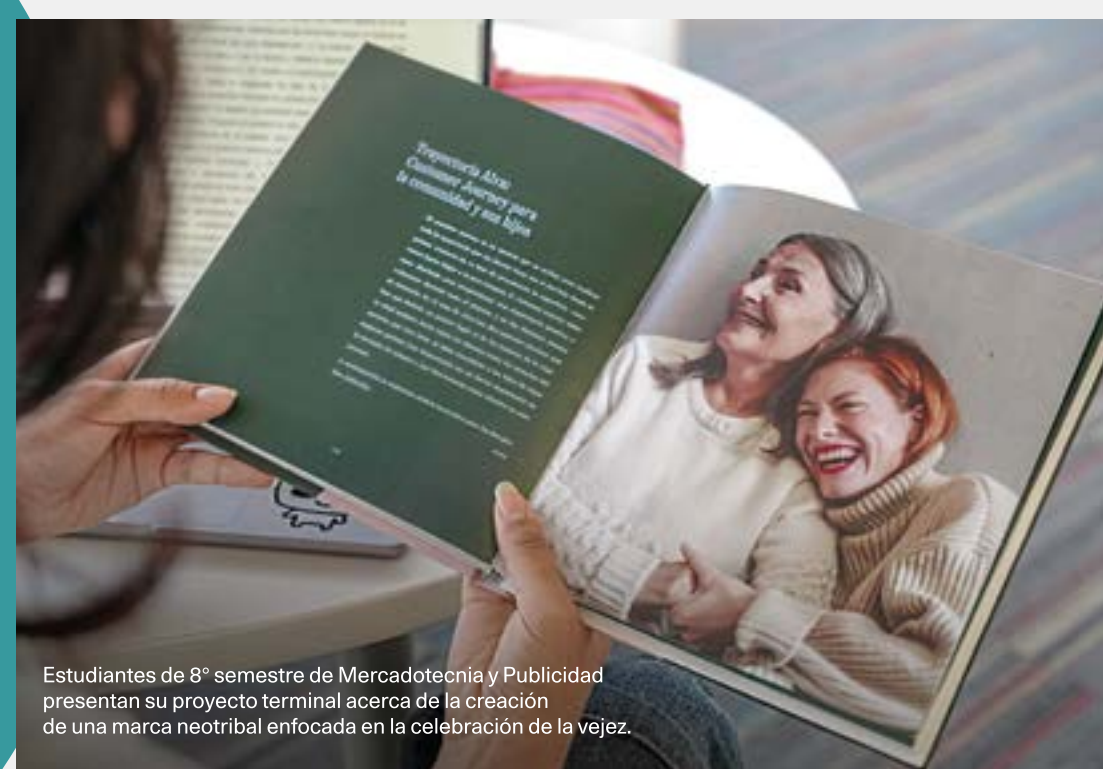
Estudiantes de 8° semestre de Mercadotecnia y Publicidad presentan su proyecto terminal acerca de la creación de una marca neotribal enfocada en la celebración de la vejez.

Actualmente es director de Ámbito Docentes en CENTRO.